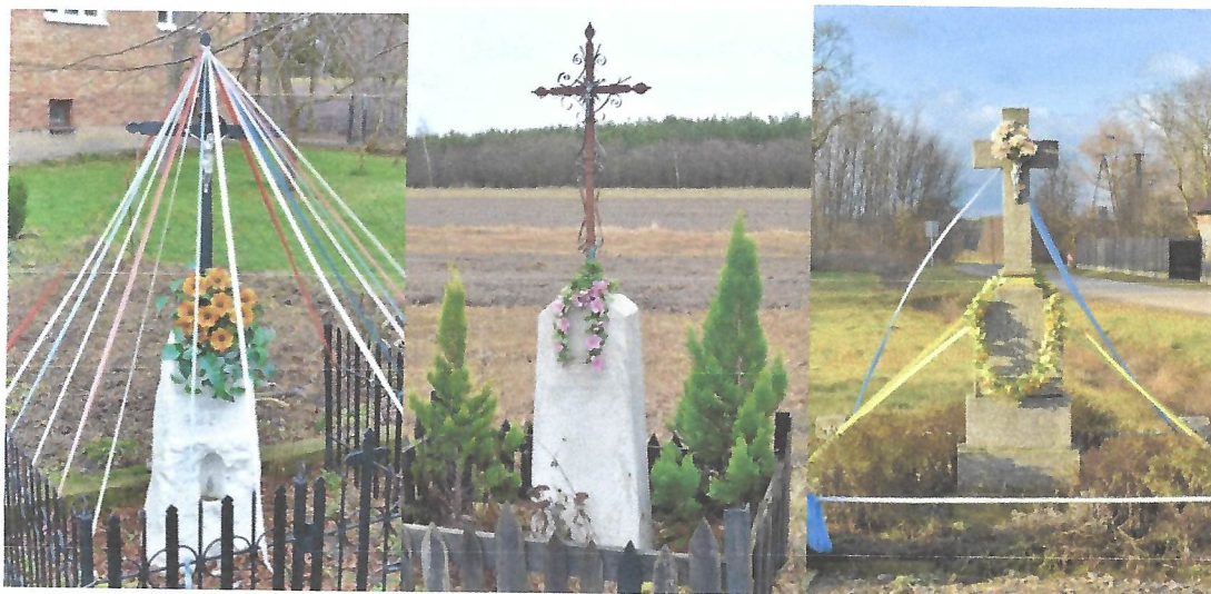
Kapliczka przydrożna w Słoszewie