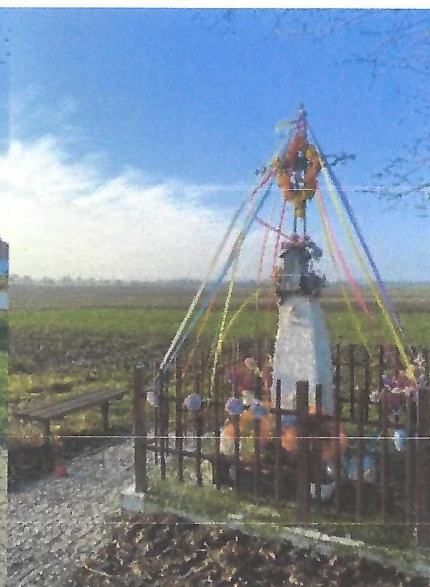
Kapliczka przydrożna w Poświętnem