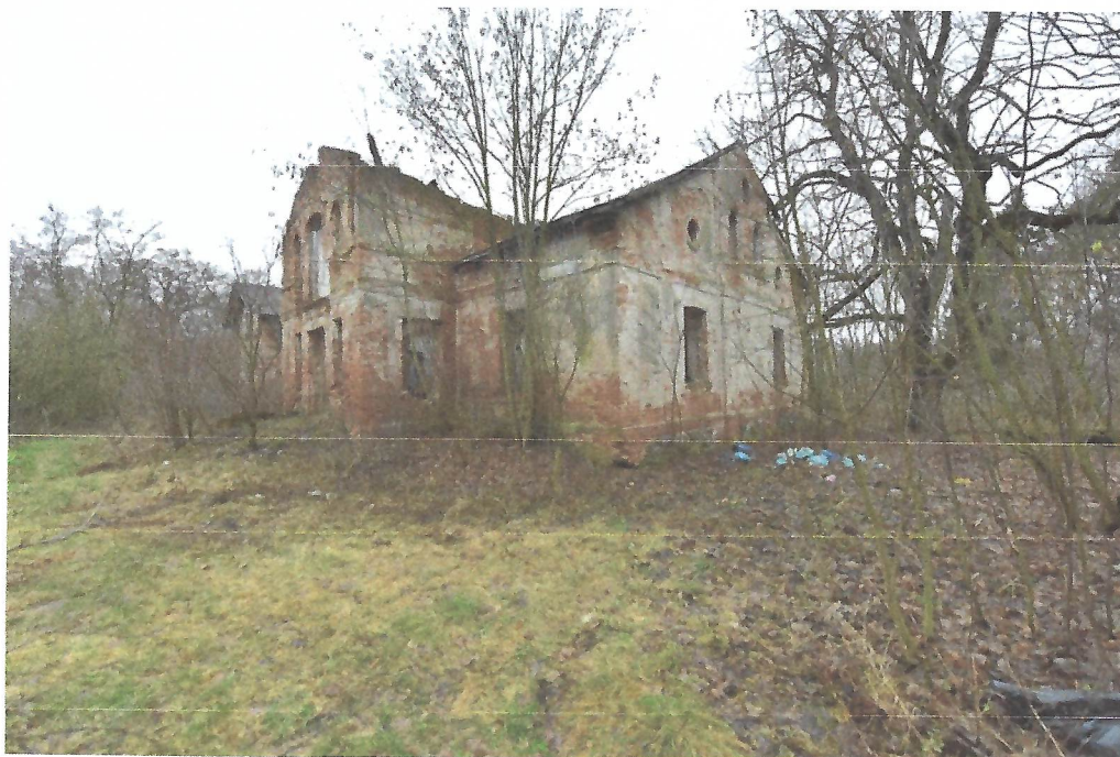
Obecny widok Zespołu dworskiego w Dalanówku: