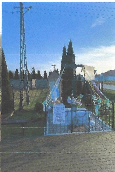
Kapliczka przydrożna w Ćwiklinie