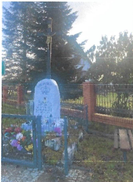
Kapliczka przydrożna w Brodach