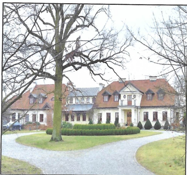
Zespół dworski w Bogustawicach