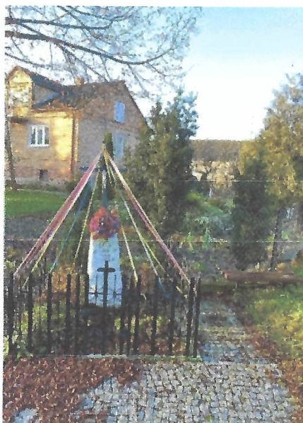
Kapliczka przydrożna w Słozewie