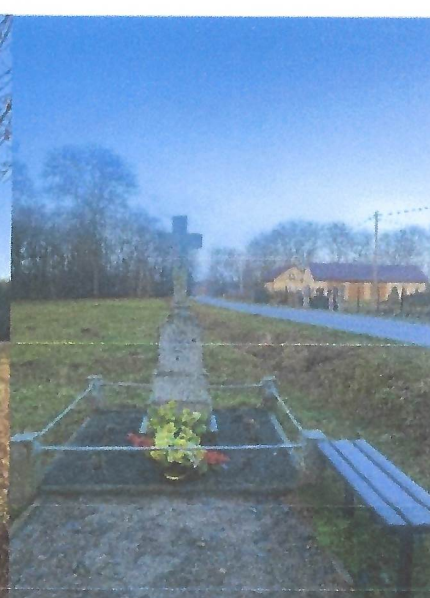
Kapliczka przydrożna we Wroninku