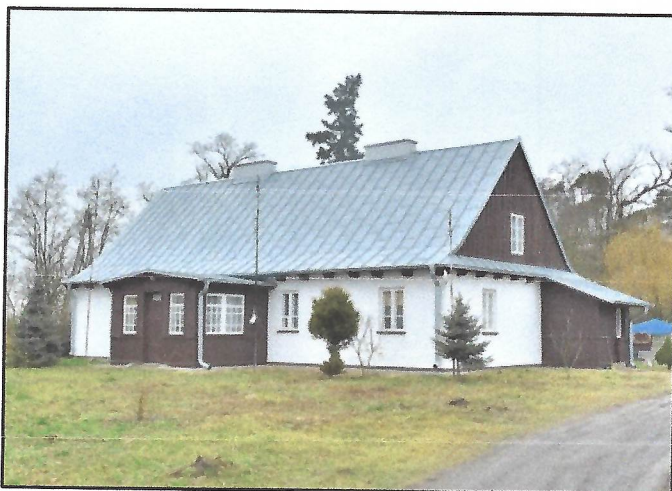
Zespół dworski w Nowych Koziminach