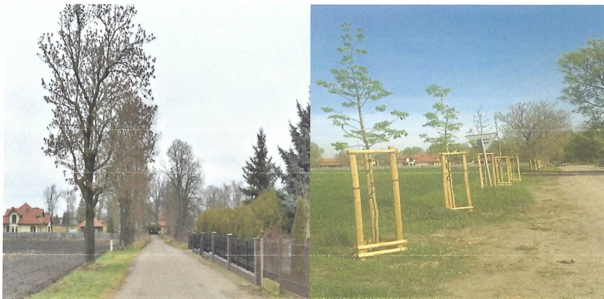
Aleja Kasztanowa w Strachówku przed i po wykonaniu nasadzeń zastępczych drzewostanu.