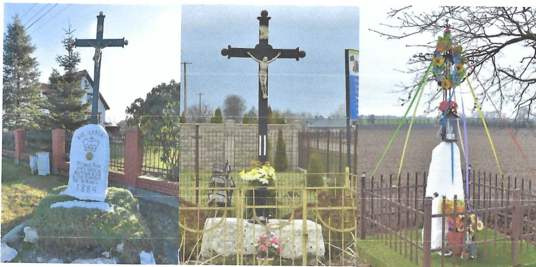
Kapliczka przydrożna w Brodach