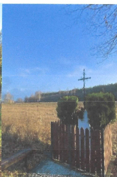
Kapliczka przydrożna w Słozewie