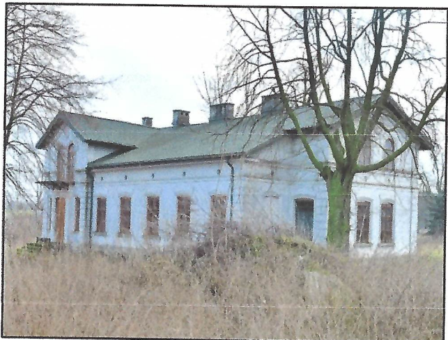
Zespół dworski w Skarżynie